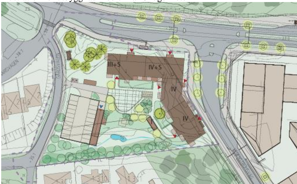
Illustration för utbyggnad med cirka 45 lägenheter

Den nya bebyggelsen är placerad i kvartersform orienterade utmed Sockenvägen och Hedenströms väg och öppnar sig mot söder och väster mot den gemensamma gården. Flerbostadshuset är stadsmässiga i karaktären med genomgående trapphusentréer. Våningsantalet varierar från tre upp till fyra våningar. För att ta upp nivåskillnaden mot Sockenvägen har den nordliga byggnadskroppen en sluttningstvåning, som vänder sig mot den gemensamma gården. Lägenheterna i husets bottenplan förses med uteplatser in mot gården. Gården är i övrigt gemensam med platser för utevistelse och lek.